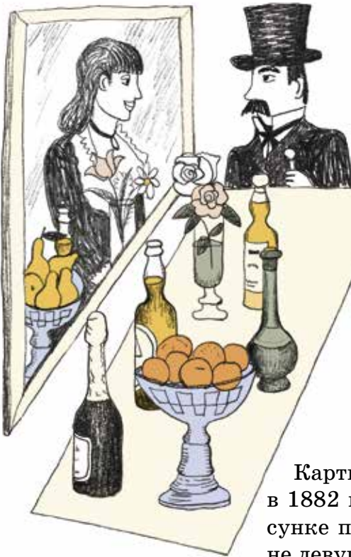
БАР В «ФОМ-БЕРЖЕР»