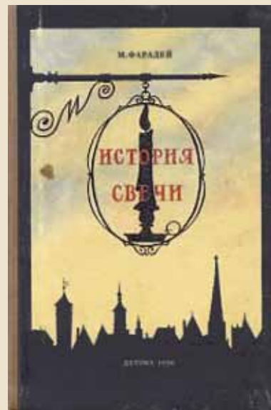
Обложка книги «История свечи» (Москва, Детгиз, 1956)